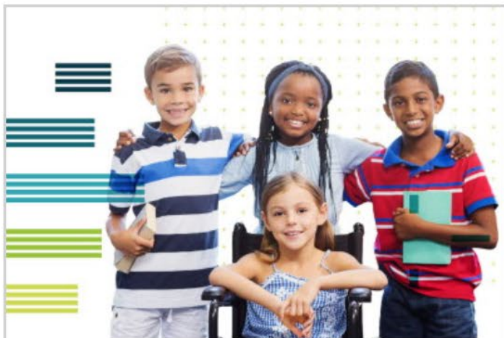
Kunnskapsgrunnlag og kvalitet - Hvor er vi?

Utviklingsprogrammet ABSOLUTT skal gi kommunene og fylkeskommunene økt forståelse og kunnskap om deres ansvar for barnehage, skole og oppvekst. Det skal også gi innsikt i hva som virker inn på barn og unges læring, utvikling, trivsel og tilhørighet.