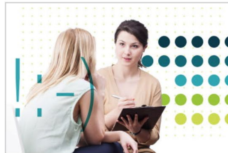
Utviklingsprosessen – Hvordan kommer vi dit vi vil?