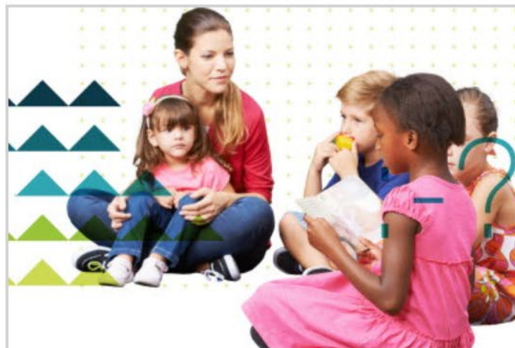
Framtidsbilder – Hvor vil vi? Framtidsbilder er et verktøy i arbeidet med å