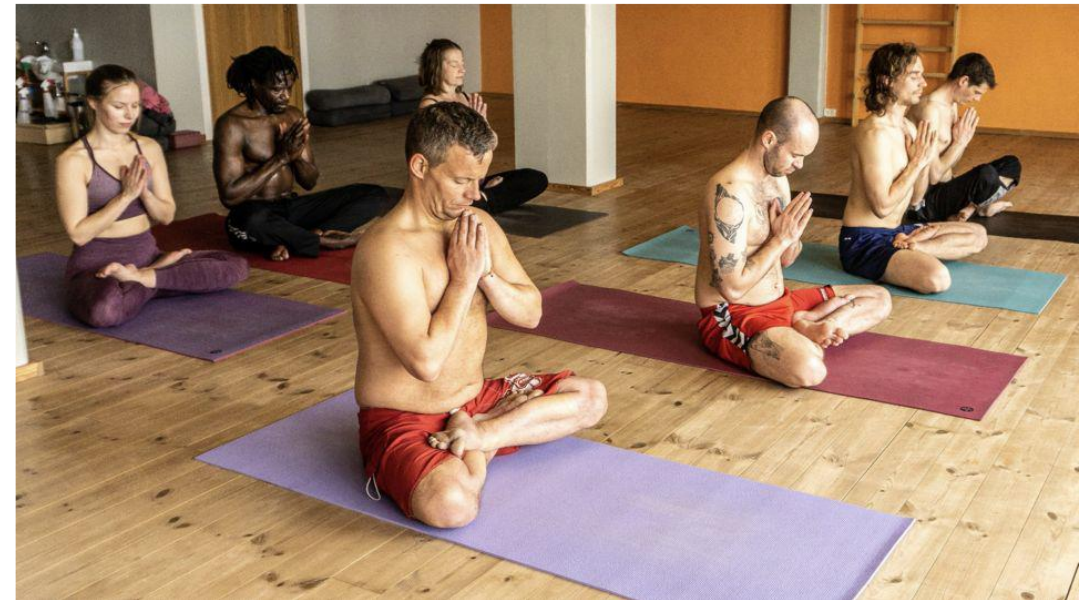
Foto: Back in the ring