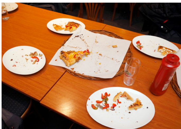
Populært: Både tiltaket og dagens meny er populært.