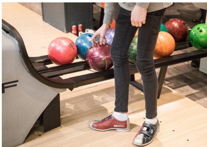
Viktig tiltak: Jevnlige treff har stor betydning.