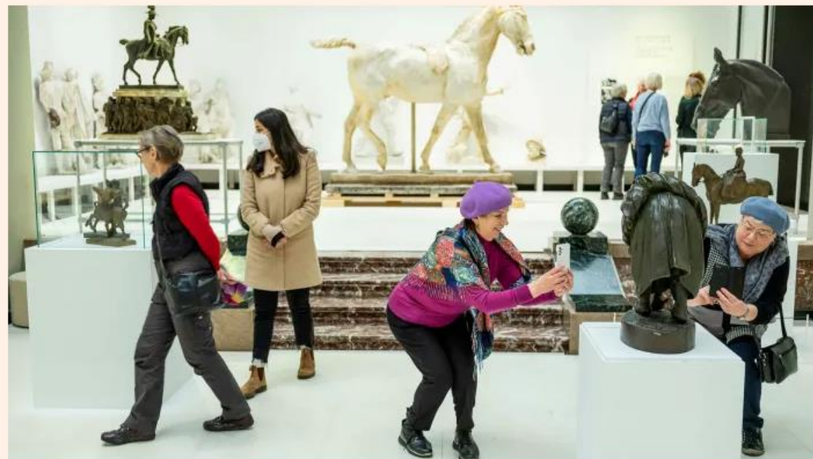
Visitors without protective face masks at the Ny Carlsberg Glyptotek museum in Copenhagen. Denmark recently removed remaining coronavirus restrictions

High levels of rules compliance and vaccine take-up found in Nordic and East Asian nations