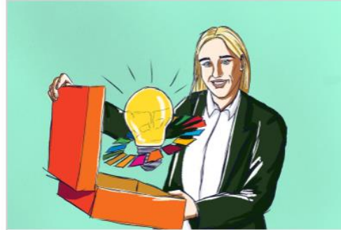
Det store fremtidsbildet