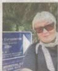
UNDERTEGNEDE: På feriebesøk ved Scandinavian School of Brussels i juni 2017.

Inderøy kommune har søkt og fått tildelt Erasmus + midler. Dette er midler som EU legger ut til disposisjon etter en vurdering av søknad. Når søknad