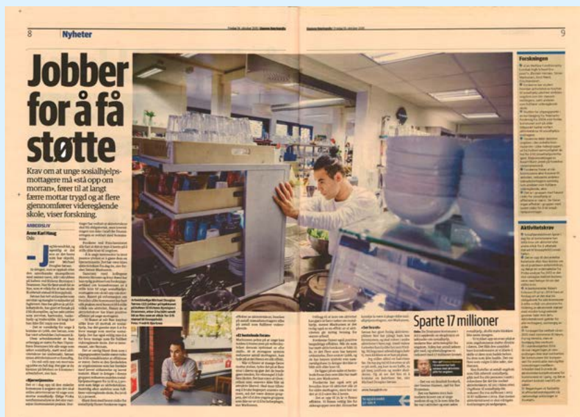
Faksimile fra Dagens Næringsliv, 6. oktober 2015.